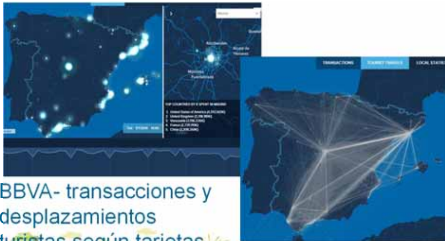
BBVA- transacciones y desplazamientos turísticos según tarjetas

20/01/2016, neZEH 2016 International Conference, FITUR Green 2016, Madrid, Spain